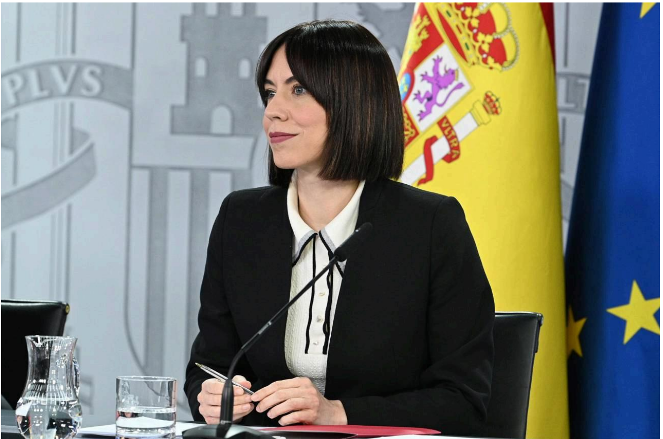
Diana Morant, ministra de Ciencia, Innovación y Universidades.