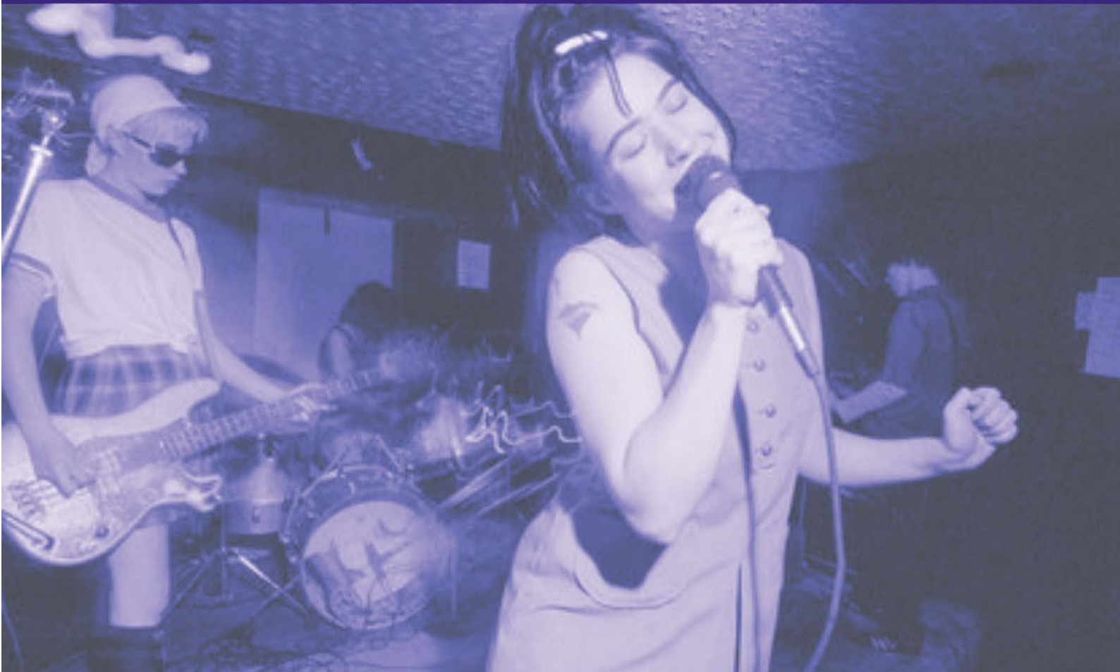
Concerto do grupo Bikini kill, asociado ao movemento Riot Grrrl.

Publicación mensual da Unidade de Igualdade