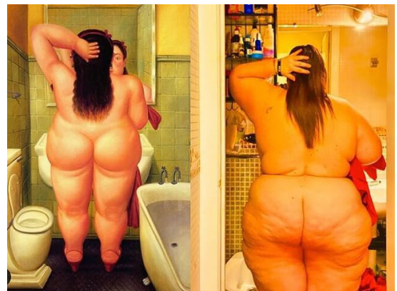
Fotografía de Itziar Castro emulando un cadro de Fernando Botero.

O falecemento recente de Itziar Castro, actriz e activista, conduciu a un alude de comentarios sobre o seu corpo e a súa saúde nas redes sociais. O feito de que a familia e as achegadas dunha persoa gorda non poidan nin sequera vivir o loito á marxe da violencia deixa ver ata que punto a gordofobia está entrecida no pensamento colectivo. Estes ataques, levados a cabo moitas veces en nome da saúde, obedecen a prexuizos estendidos incluso polo propio sistema sanitario. Non podemos esquecer que o barómetro empregado para medir a masa corporal das persoas, o IMC, só ten en conta o peso e a estatura de cada paciente. Polo tanto, esta ferramenta xa obsoleta non ten en conta todos os parámetros da composición corporal.