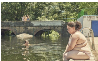
Fotograma da película